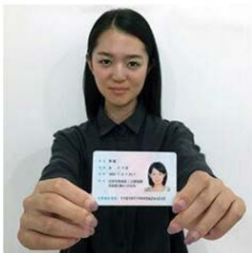
手持身份证照片示例