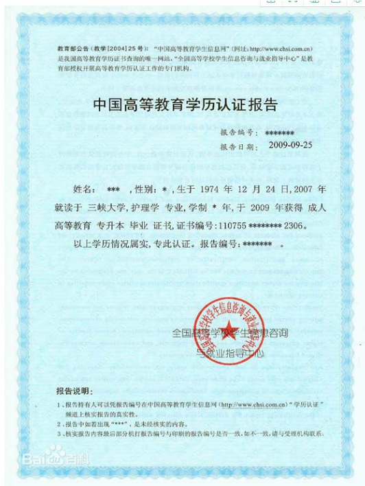
教育部学历认证报告照片示例