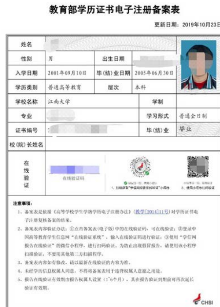
教育部学历证书电子注册备案表照片示例