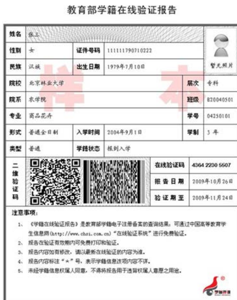
教育部学籍在线验证报告照片示例