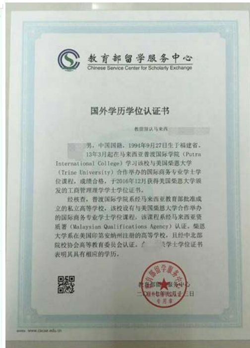
教育部留学服务中心出具的认证报告照片示例

8. 未取得毕业证的自学考试和网络教育本科生 (须于录取当年入学前取得国家承认的本科毕业证书) 提供省市自学考试办公室或高校出具的相关证明 (如盖章的成绩单、届时能够毕业的证明原件照片)。