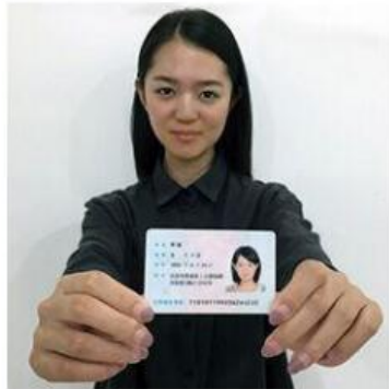
手持身份证照片示例