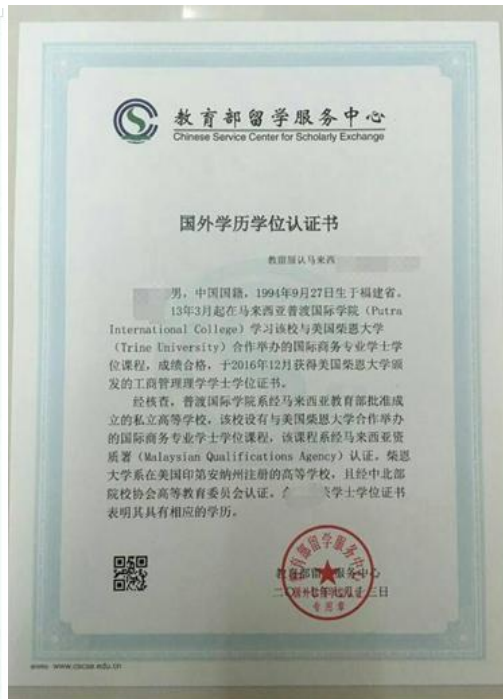
教育部留学服务中心出具的认证报告照片示例